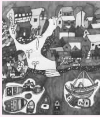
镇海区骆驼中心学校 四年级小记者 刘昊轩(证号1604920)