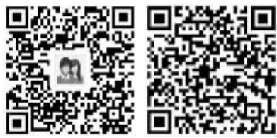
QQ理财群 微信理财群

需要提醒大家的是,合格投资者可通过4家银行的借记卡将资金转入宁波股权交易中心账户。其中,中行借记卡需开通电话银行;建行借记卡需开通U盾版专业网银;交行卡、平安银行借记卡需开通专业网银。