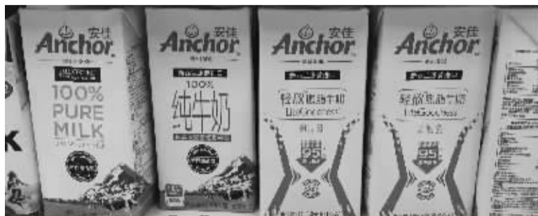
进口奶价格比较高。