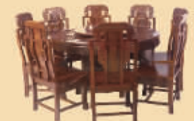
酸枝木1.38米圆桌: 1.68万元