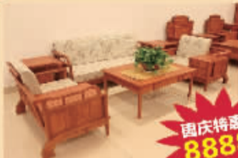
江南之博沙发6件套