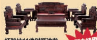
红酸枝11件财源沙发