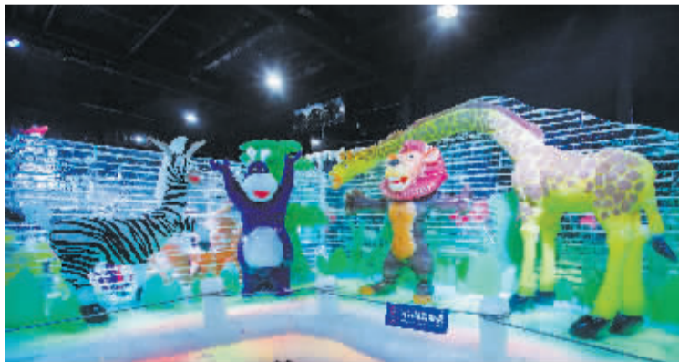
马达加斯加主题冰雕