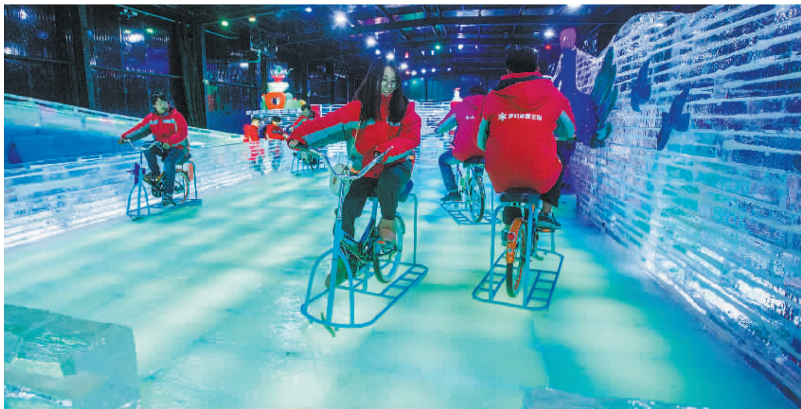
游客正在体验冰上自行车。