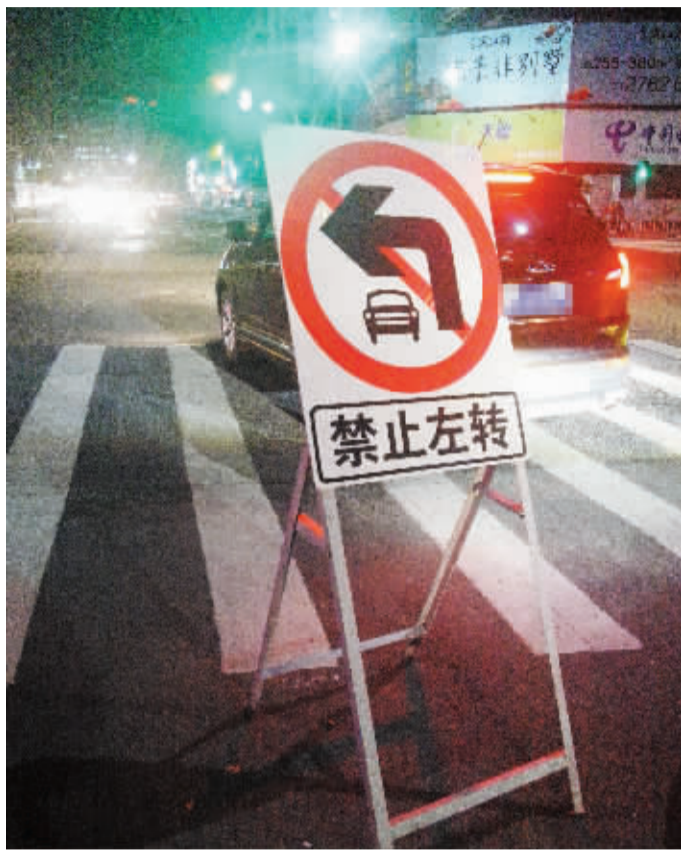
一辆黑色轿车在路口差点左转。

交警部门提醒,管制道路已放置提醒标志,路口也有电子警察,请市民朋友遵守管制,出行前提前规划好路线,相互转告。管制期间,请车主配合现场交通管理人员指挥,遵照现场交通标志、标线指示通行。如果遇到即时前方绿灯,但路口车辆较多的情况时,请车主暂时不要前行,自觉将车停在停车线内,放空路口。待路口通畅时再通过该路口,避免发生拥堵。