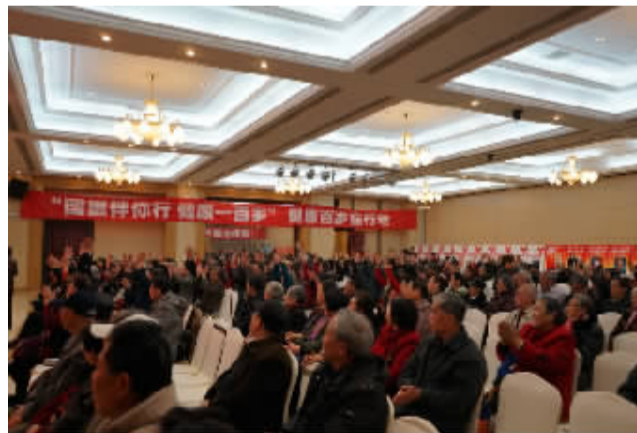
▲2016年4月无锡大型公益报告会现场

郑重声明:本次活动是由中国老年学学会中医研究委员会主办,不收取任何费用,请相互告知,名额已不多,报名仅剩3天,请抓紧时间!