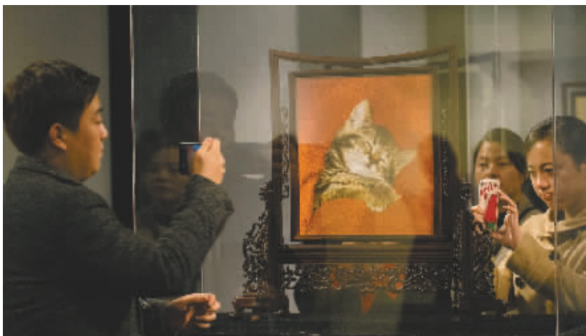
市民在欣赏《憨甜》这件双面异色绣作品。

她为德国前总统魏兹泽克绣的画像,被魏兹泽克认为是“真正的东方艺术品”而珍藏;她绣的屏风,被安放在G20杭州峰会的贵宾室……昨天起至12月11日,“水韵琴丝”杭绣大师陈水琴师徒作品展在宁波117艺术中心开展,市民可近距离欣赏陈水琴的杭绣佳作。