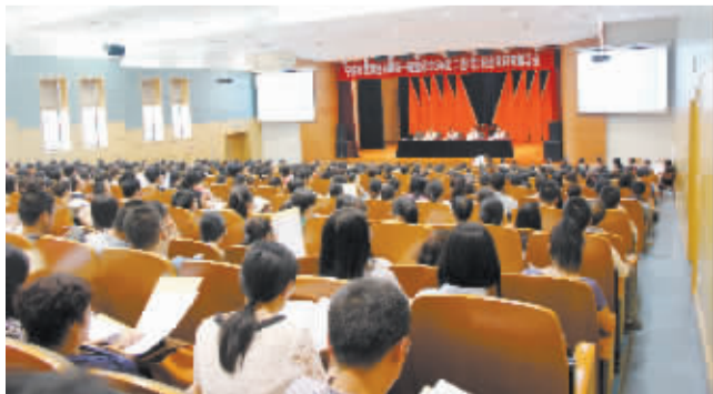
▲宁波市国家税务局第一稽查局出口退(免)税企业自查辅导会现场。