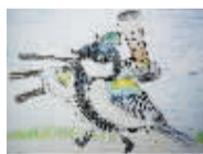
大山雀 的博物旅行

从10年后的现在回过头来看，2006年的我，就是典型的菜鸟，虽然不时会闹出点笑话来，但菜鸟自有菜鸟的快乐。