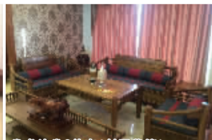
卷帙沙发6件套(刺猬紫檀)