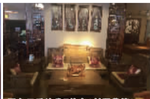
国色天香沙发7件套(刺猬紫檀)