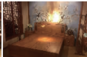
明式大床3件套(刺猬紫檀)