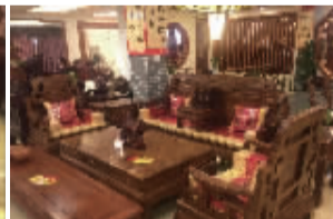
六合同春(刺猬紫檀)