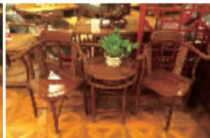
情人椅3件套(刺猬紫檀)