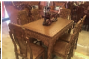
长餐桌+6椅(刺猬紫檀)