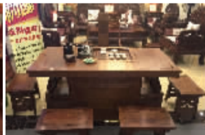
将军椅6件套(刺猬紫檀)