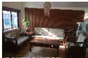
明式双圆沙发(刺猬紫檀)