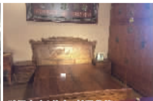
财源大床3件套(刺猬紫檀)