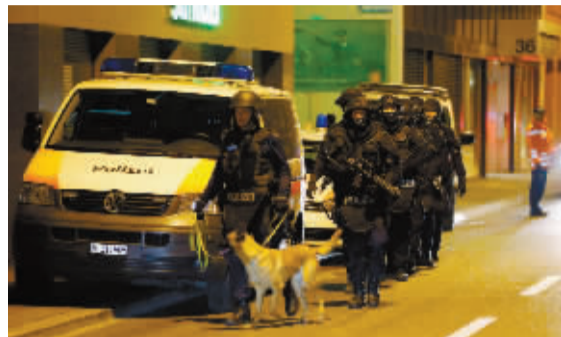
12月19日,在瑞士苏黎世,瑞士警方在清真寺外警戒。