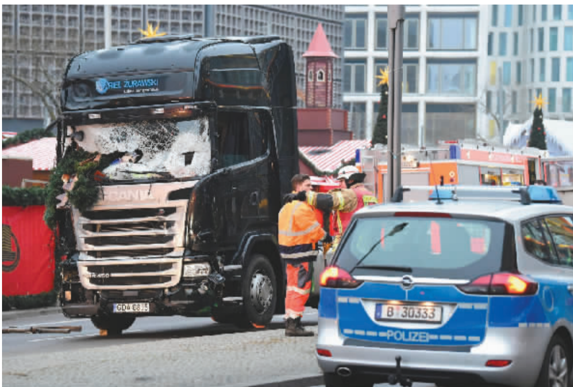
这是12月20日在德国柏林拍摄的冲闯圣诞集市的货车(左)。