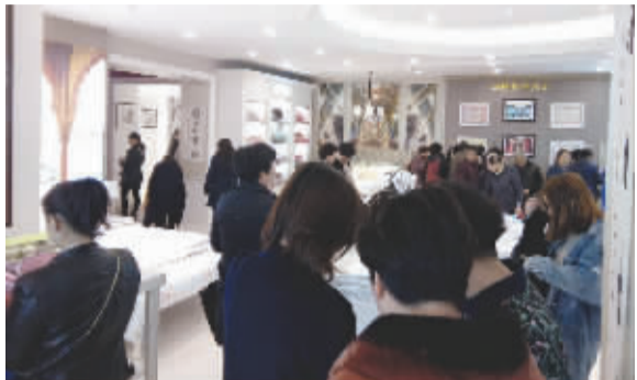
各地科研团队参观博泰直营店千层生态棉展区。