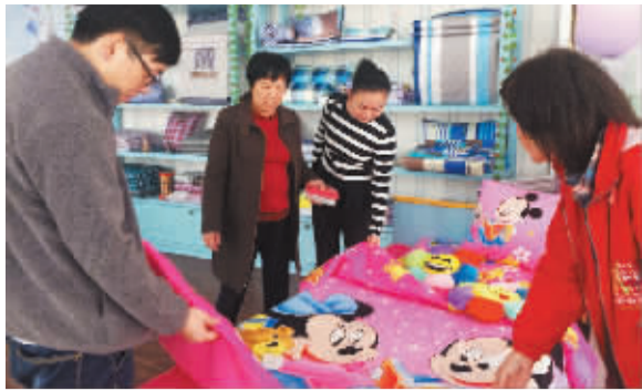
春节快到了,热热闹闹的儿童生态棉被吸引人的眼球。