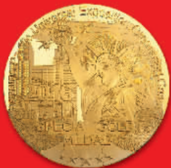
在美国获特等金奖

一名不愿透露姓名的内政部官员告诉新华社记者，一辆装有炸药的汽车在巴格达东部萨德尔城爆炸，除造成大量人员伤亡外，周围店铺和市场也在爆炸中严重受损。目前尚无组织宣布制造了这起袭击事件。