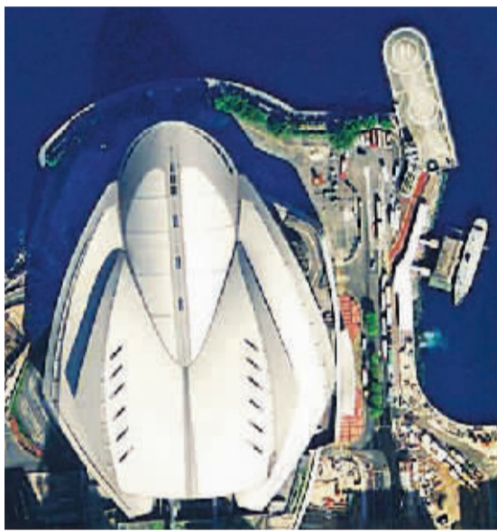
香港会议展览中心。

高景一号的运营,将为用户提供以高空间、高光谱分辨率和全天候对地观测能力为核心的遥感数据及增值应用服务,以及应用系统解决方案。服务对象涵盖测绘、国土资源调查、城市建设、农林水利、地质矿产、环境监测、国防安全和应急减灾等众多传统行业。在互联网、位置服务、智慧城市、金融保险等新兴行业也具有巨大应用潜力,通过与移动互联网、导航定位、智能终端和虚拟现实等新兴技术融合,将有力推动我国遥感技术真正融入政府管理、企业生产和大众生活,打破我国高分辨率卫星遥感市场被国外垄断的局面。