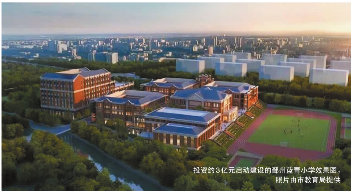
投资约3亿元启动建设的鄞州蓝青小学效果图。

据悉,这14项亿元级学校项目分别为:投资1.8亿元,启动建设浙江大学宁波研究院科研大楼;投资5.25亿元,启动建设宁波TAFE学院二期工程;投资2.98亿元,启动建设宁波大学潘天寿艺术设计学院;投资1.6亿元,启动建设宁波电大终身教育大楼;投资1.8亿元,启动建设浙江纺织服装职业技术学院中英时尚学院综合楼;投资1.6亿元,启动改建宁波城市学院溪口校区;投资1.6亿元,启动建设宁波市职教中心学校(荷池路校区);投资1亿多元,迁建海曙区章水镇中心小学;投资1.69亿元,启动建设鄞州区首南第三小学(暂名);投资1.68亿,启动建设鄞州潘火实验中学;投资约3亿元,启动建设鄞州蓝青小学;投资1.7亿元,启动建设鄞州长丰地块小学;投资2.5亿元,启动建设宁波杭州湾新区滨海小学;投资5.2亿元,启动建设宁波科学中学。