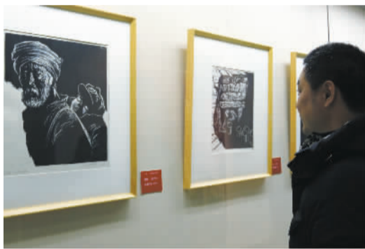
市民观看赵延年版画。

展出的《梦幻》是20幅连环画式的系列作品,以1927年鲁迅先生在广州中山大学执教期间的经历为题材。不同于单幅肖像作品,系列版画要