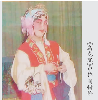
《乌龙院》中饰閻惜娇