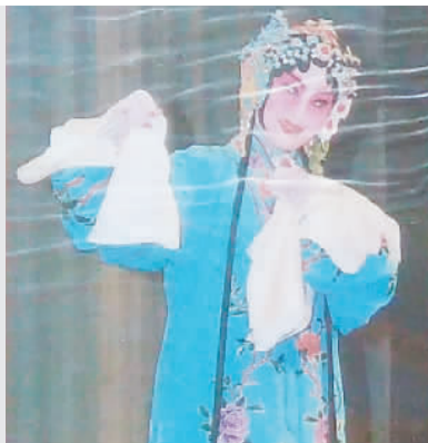
《勤玉钗》中饰俞素秋