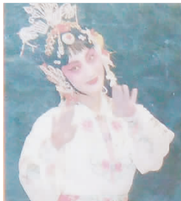
《富贵图》中饰尹碧莲