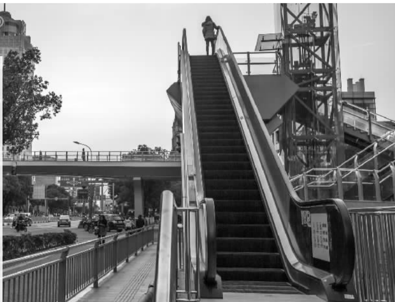
日新街天桥。

昨天上午,随着6座手扶自动电梯、垂直电梯调试完毕,日新街人行天桥开始试运行。据了解,这是药行街、柳汀街上的第三座行人过街天桥。市第一医院、妇儿医院天桥投入使用后,平均车速提高10%。另外,今年我市还将开工建设宁大附属医院天桥。