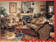
大森 28888元/套 沙发组合+茶几组合(限1套)