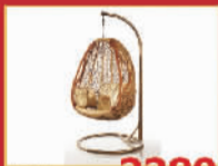
藤缘 2280元/套 鸟巢吊椅,限量10套