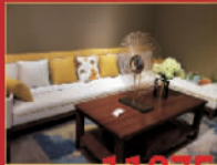
唯煌家具 11875元/套 沙发茶几,限量1套