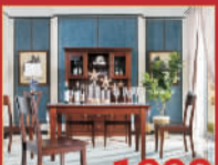
优家故事 1998元/张 餐桌