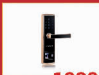
德国凯迪仕 1999元/把 指纹密码锁,限5把