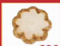
诺瑞地毯 680元/个 澳毛梅花鹿羊皮,限量2个