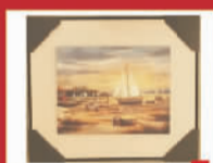
横路七号画艺 5元/幅 装饰画,限量20幅