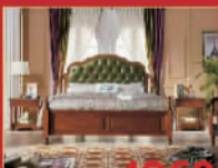
中至信 4960元/套 实木真皮大床,限量6套