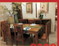
亿东方 8300元/套 餐桌(一桌六椅)