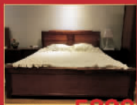
千佳御品 5800元/套 床+两个床头柜