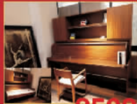
楷模 8500元/套 钢琴烤漆床,限量1套