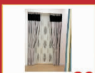
新景点布艺 80元/米 窗帘