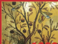
JNJ马赛克 1980元/套 钢琴烤漆马赛克,限量2套(1.2米*1.2米)