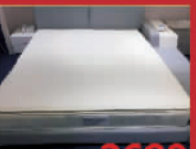
爱舒床垫 2680元/张 杜邦大德床垫,限量3张