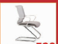
印象北美 590元/把 书椅