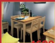
博思亚 4680元/套 一桌四椅,限量5套