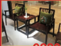
檀颂 9880元/套 101休闲椅,限量3套