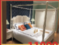
木槿之恋 11800元/套 床+床头柜+衣柜