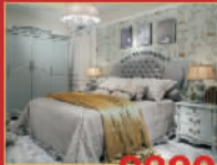
美廷 8880元/套 实木皇帝床椅,限量2套