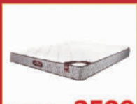
梦神床垫 2599元/张 1.8米床垫,限量10张