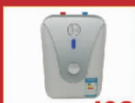
美国瑞美 498元/台 6升小厨宝,限量5台