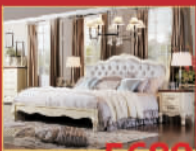
维克森林 5680元/套 1.8米实木双人床,限量1张