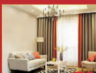
一帘艺术软装 78元/米 棉麻素色窗帘