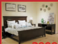
90HOME 2999元/套 床,限量5套