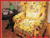
印象北美 1999元/把 休闲椅