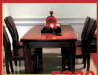
杜莎 5280元/套 一桌四椅