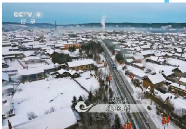
黑龙江的“北极村”漠河县。