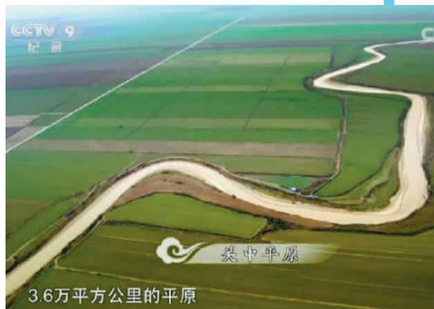
陕西的关中原。《航拍中国》视频截图