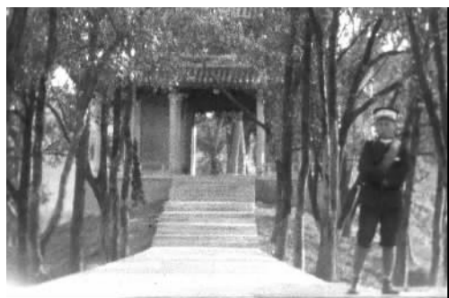
武岭头执勤的警察。