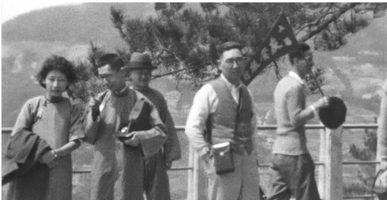
友声旅行团在妙高台。