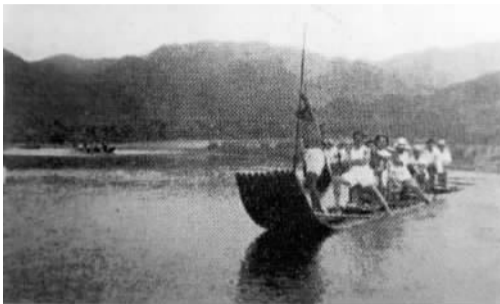
友声旅行团游剡溪。