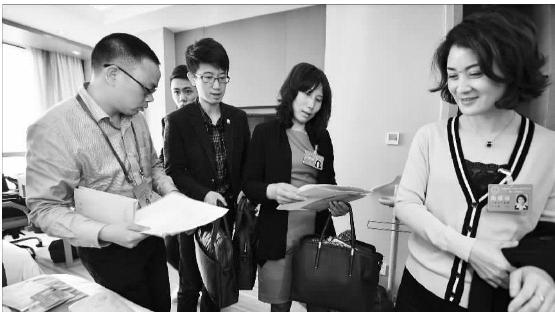
昨天,参加市十五届人大一次会议的代表到驻地报到。图为宁海县代表团代表在报到。

的作风,集中精力、集思广益,认真审议好大会各项报告;遵守换届纪律,充分发扬民主,严格依法办事,确保圆满完成大会各项选举任务。全体列席人员要认真参加大会的各项活动,听取代表的审议发言,积极对各项报告提出意见和建议。相信在中共宁波市委的领导下,在大会主席团的主持下,经过全体代表的共同努力,这次大会一定能够取得圆满成功。