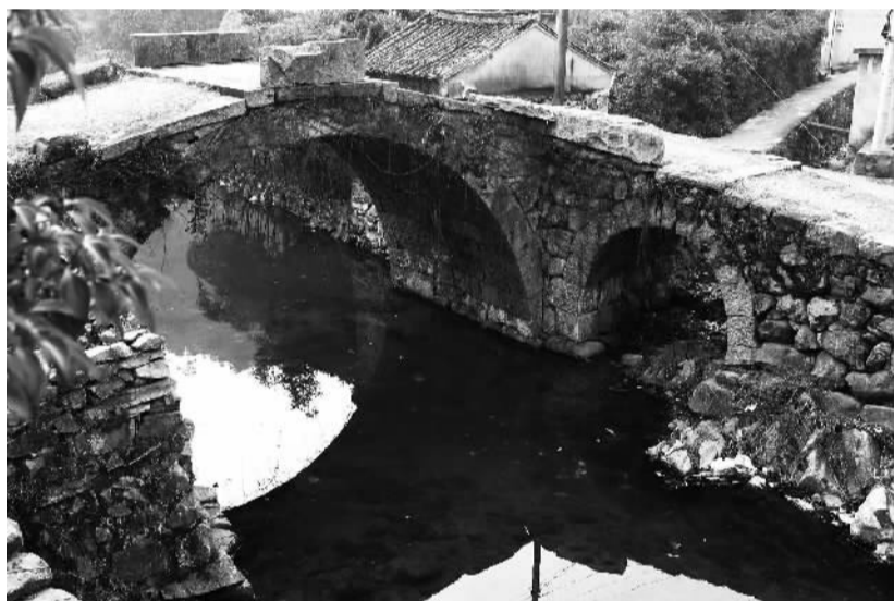
徐家村村口的两座宋代石拱桥，至今仍能通行。

你见过248年前编修的家谱吗？近日，奉化区档案局征集到了清朝乾隆、嘉庆、道光等年间编修的《徐氏宗谱》9本及《徐氏房谱》6本。其中，最早的一本《徐氏宗谱》编修于乾隆三十四年，也就是1769年，距今已经有248年的历史，它也成为目前我市档案系统征集到的最早家谱。而这个徐氏家族还形成了奉化区的一个美丽山村——大堰镇徐家村。