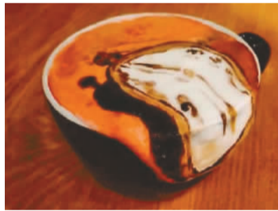
达利《记忆的永恒》中的经典软钟,咖啡画能够做出3D呈现,令人惊叹!