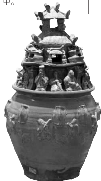
宁波博物馆馆藏越窑青瓷胡人吹弹堆塑罐。资料图片

宁波古称明州,不仅包括现在的宁波,还包括舟山等地。宁波作为“海丝”古港码头,有太多遗篇待写。经过二十世纪末本世纪初的考古发掘和文献梳理,学者们渐渐确定了城中可供寻访的海丝遗存,刻碑勒石以记。唐宋造船厂遗址、海运码头、宋元天妃宫、明四明驿、市舶司、来远亭、波斯馆……这些皆有旧址可寻。最直接的还属地名,比如东渡门内的波斯巷,象山沿海的新罗岙,舟山一带的马秦山。海外商旅聚集明州的记忆,就遗留在这些离我们既近又远的地名文化中。