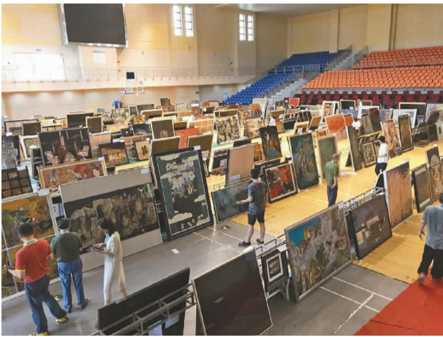
首届中国(宁波·北仑)青年漆画大展复评现场。

本报讯(记者 陈晓旻)昨日,首届中国(宁波·北仑)青年漆画大展复评在北仑宁波职业技术学院举行。10多位专家从在北京通过初评的350幅漆画作品中,复评出220幅入选画展。据悉,画展将于8月4日至8月27日在宁波美术馆举行。记者第一时间获悉,宁波此次有15幅作品入选画展,其中4幅获得入会资格。