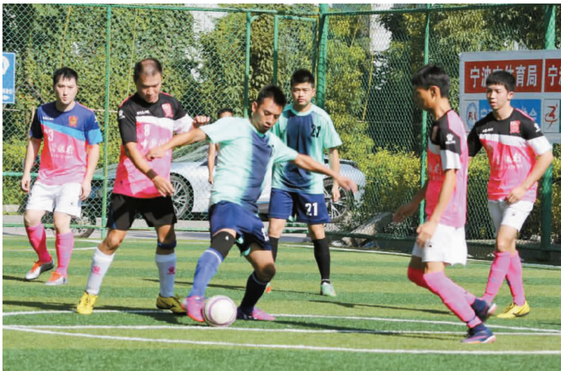
高新区英联赛区比赛场景。