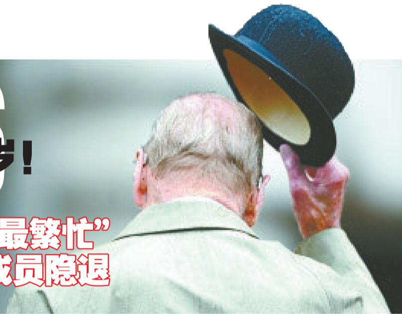
菲利普亲王2日最后一次履行王室公务。

2日,英国女王伊丽莎白二世的丈夫、96岁高龄的菲利普亲王出席一场慈善活动后退休,从此不再承担出席公众活动的王室职责。不过这并不意味着这位常常因开玩笑说错话登上头条的王室成员从此消失在公众视线,白金汉宫说,菲利普亲王未来仍有可能陪同女王出席特定场合。