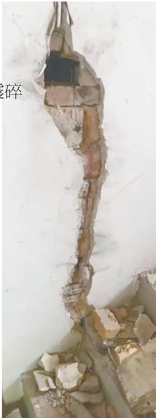
楼房被雷击中后出现很大的裂缝。

昨天,记者从市气象局防雷中心了解到,目前农村自建住宅大部分是随意修建的,没有施工图,更谈不上防雷设计。随着极端雷暴天气的增多,建议农村房屋在建设的时候,也要注意采取防雷措施,以免发生被雷击中的情况。