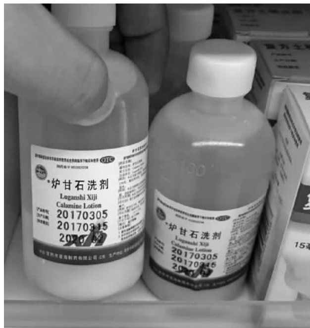
药店里，多种常用药物价格已是数月前的两三倍甚至更高。

朱女士说，按药店店员的说法，从去年开始，许多老百姓熟悉的廉价常用药都涨价了，包括红霉素眼膏、复合维生素B等，不下数十种。情况是否如此？昨天，记者进行了实地走访。