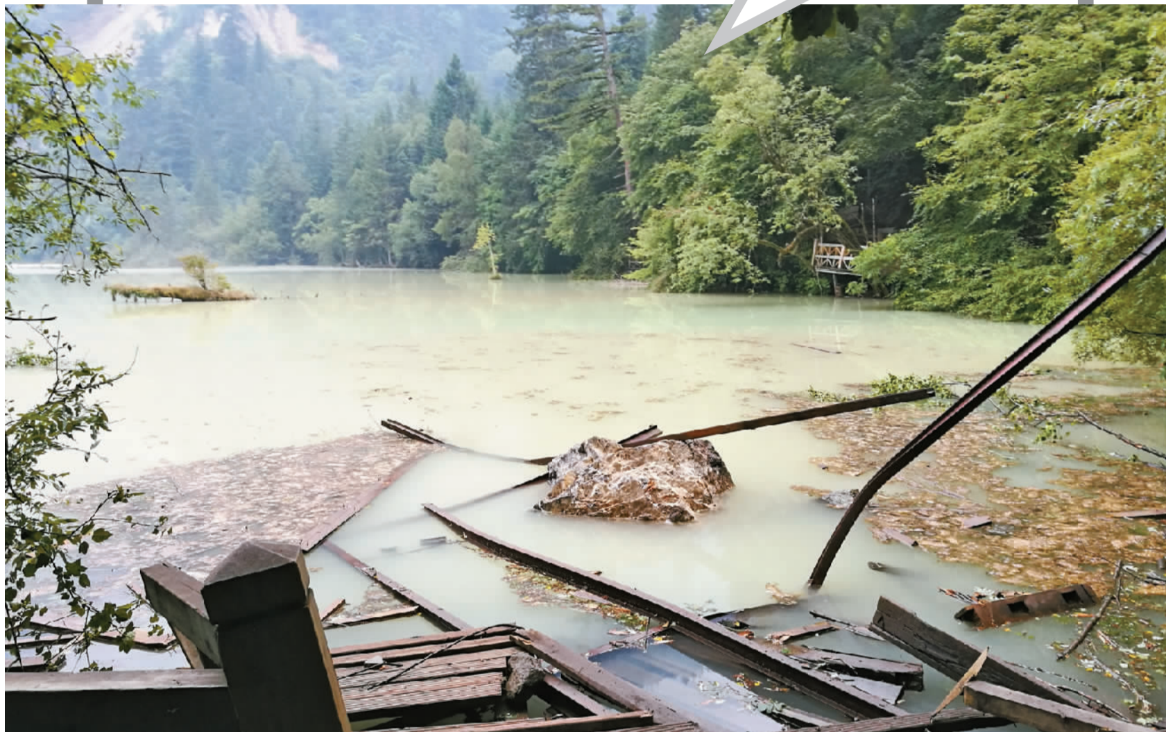
8月9日拍摄的五花海。