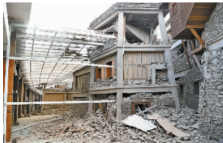
震后九寨天堂洲际大饭店。