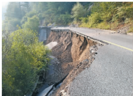
九寨沟景区内通往五花海景点的道路。