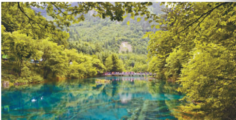
震前五花海。五花海被誉为“九寨沟一绝”，同一水域，却呈现出浅红、鹅黄、墨绿、深蓝、宝蓝等缤纷色彩。