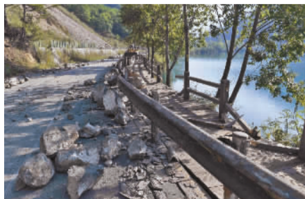
九寨沟景区内犀牛海景点旁石块随处可见。