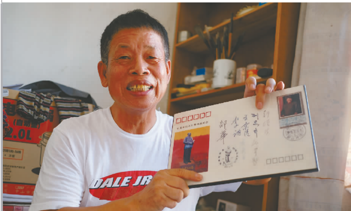
叶才晓老人讲述他和名人之间通信的故事。