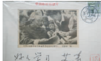
艾青回复的明信片。