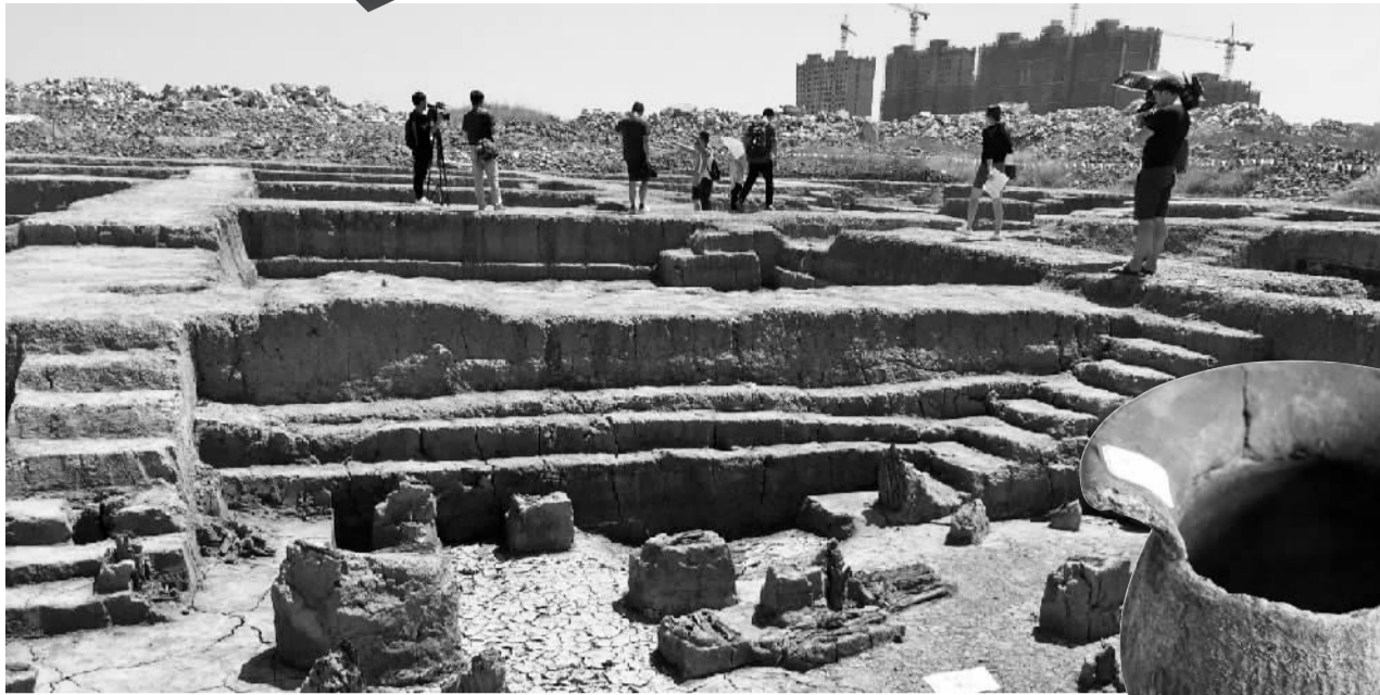
◀考古现场 陈爱红 摄