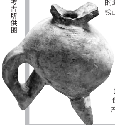
▼河姆渡文化时期的陶釜