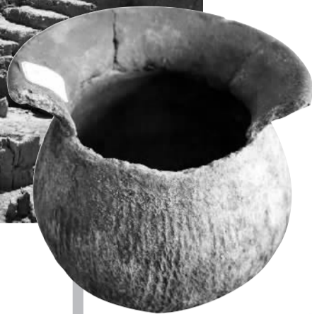
◀良渚文化时期的陶釜