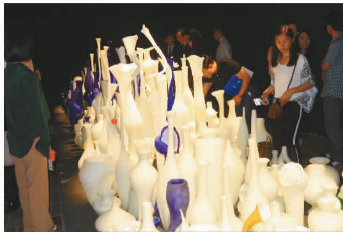
展览现场。