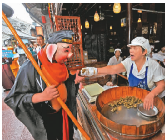
“二师兄”现身南塘老街品尝美食。

“国庆+中秋”的加长版假期已进入倒计时模式,想好去哪儿玩了吗?10月1日,象山影视城第十届影视嘉年华即将启幕。昨天,象山影视城国庆演艺新产品发布会在宁波旅游形象推广中心举行,第十届影视嘉年华的演艺新产品“疯狂现场之极限特工”和“影视大巡游”也提前亮相南塘老街表演,让市民朋友在家门口看了一场精彩的影视嘉年华。