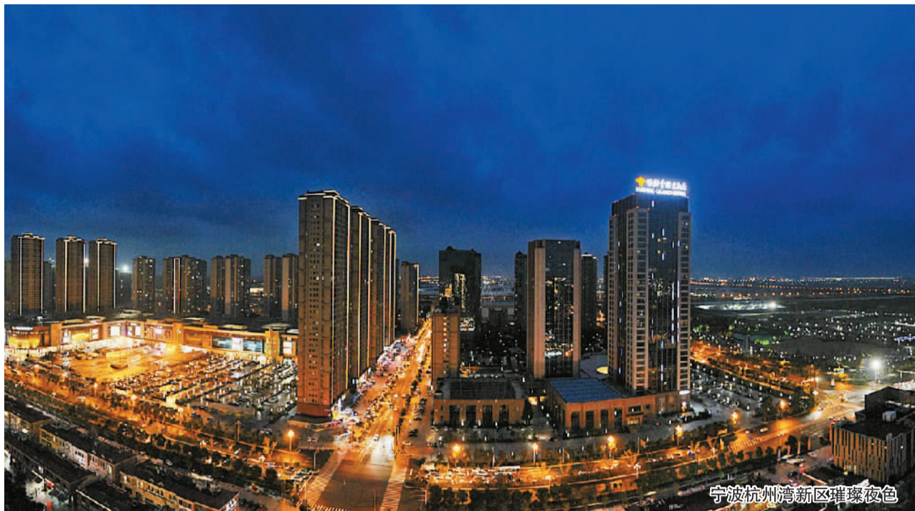
宁波杭州湾新区璀璨夜色