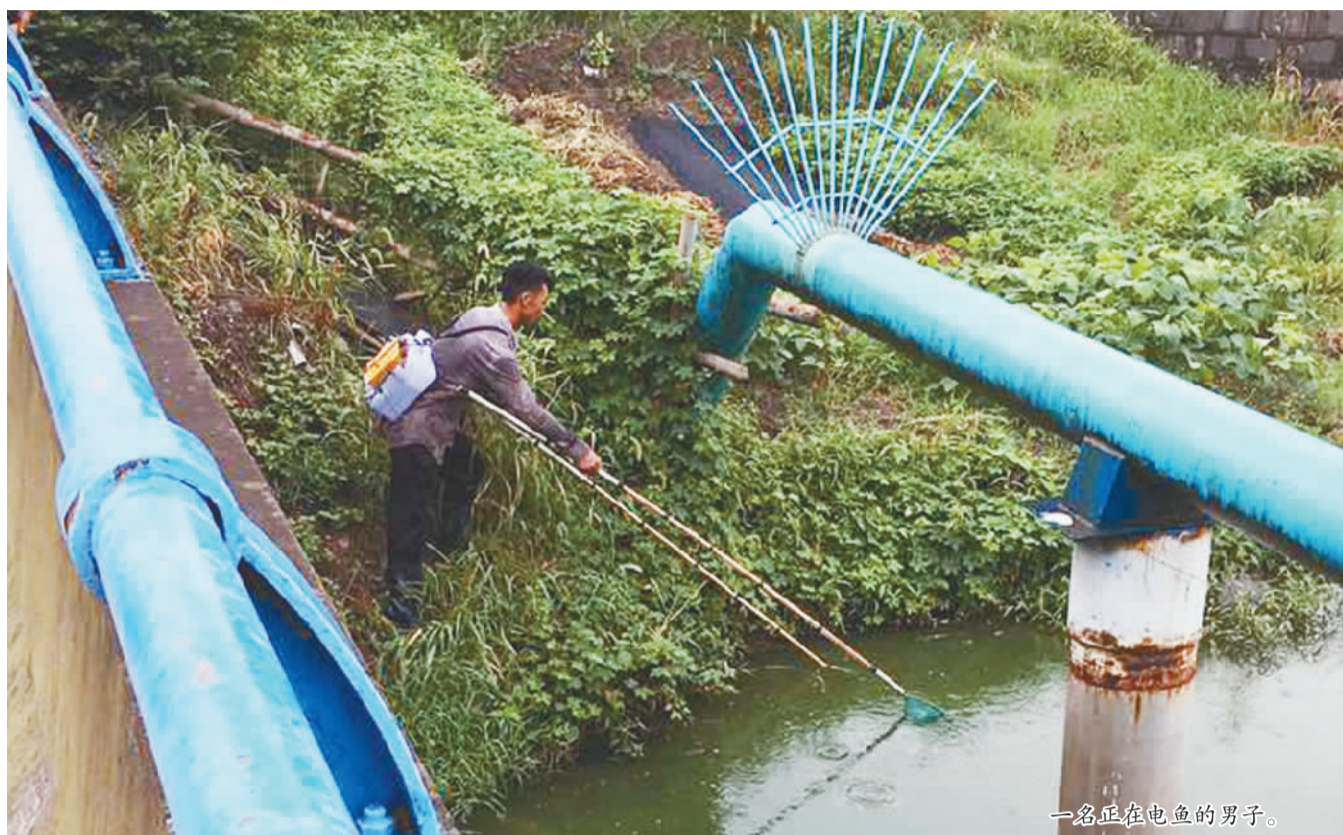
一名正在电鱼的男子。