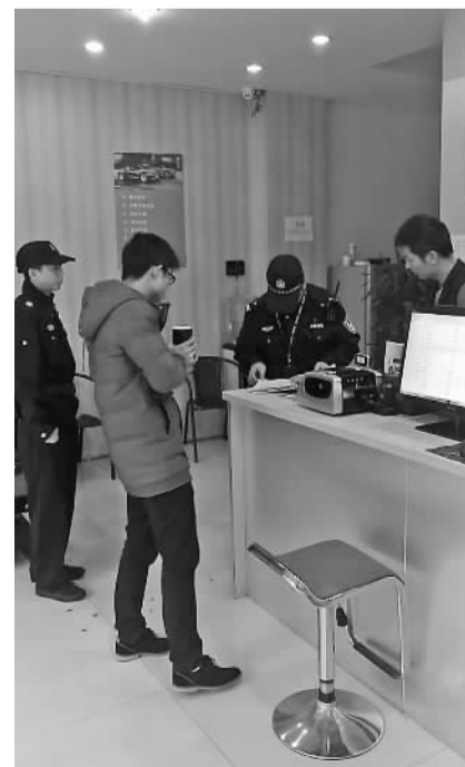
福明派出所民警巡查辖区二手车店。

另外还有一种听上去很时髦的以租代购。经纪人联系担保公司与客户签订以租代购合同,即担保公司先将车辆过户到公司名下,客户按月支付租金、使用车辆,期满后过户到自己名下。有的客户以为这种形式费用压力小,可没想到,接下来有名目繁多的各种收费,类似检测费、过户费、押金、全险等,算下来实际支出费用远远超过车价。