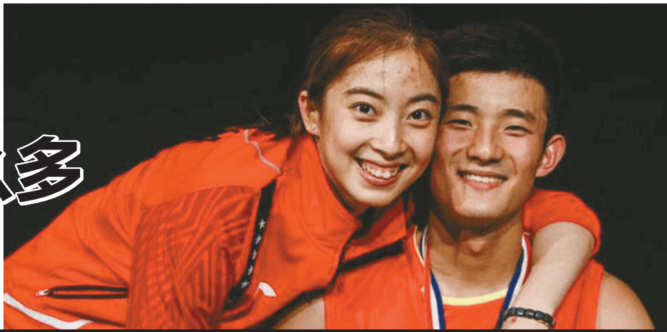
▲谔龙和王适娴终成眷属。

结束了世界羽联超级赛香港站的决战后,谔龙没有一起随队回北京,而是转道厦门,11月28日上午,他和女友王适娴出现在厦门市思明区民政局,领取结婚证。国羽又一段佳话修成正果。