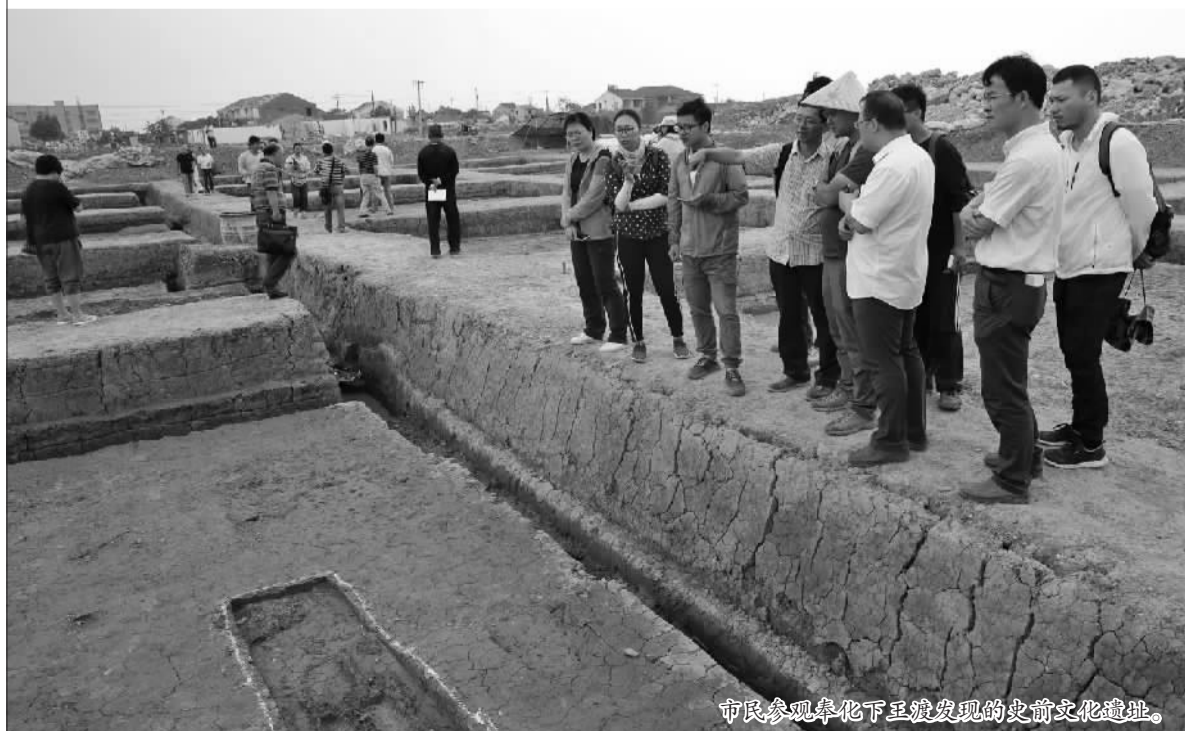
市民参观奉化下王渡发现的史前文化遗址。