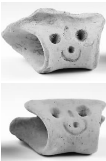
▲在鱼山遗址出土的“笑脸”陶器耳。