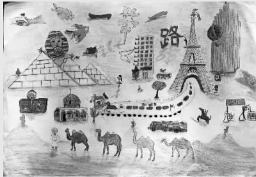
一带一路 宁波市四眼碶小学新河校区404班 赵悠然(证号WB10767)