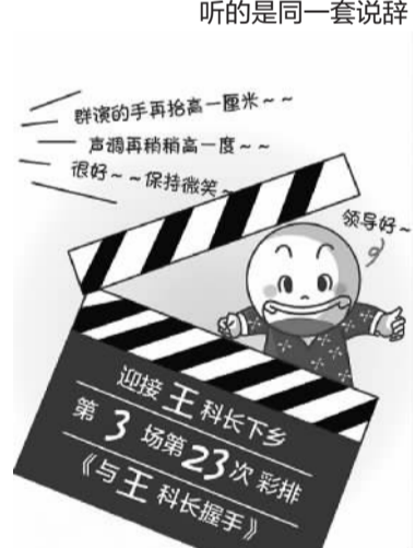
“大伙演、领导看”的走秀式调研