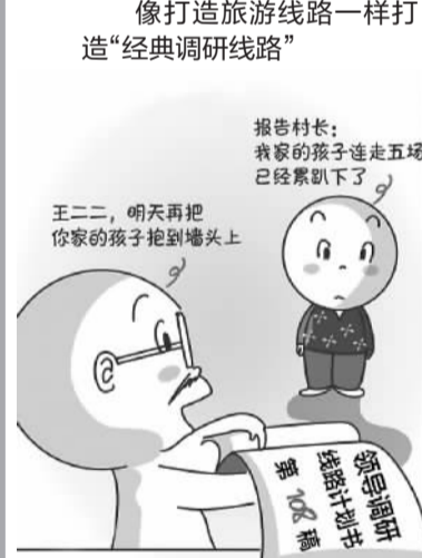
去的是同一条路线