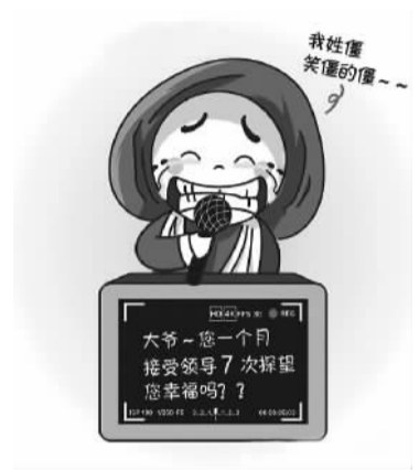
访的是同一批对象