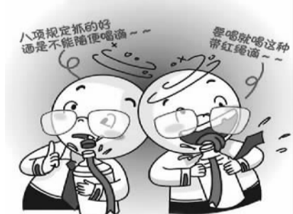
说一套做一套,我行我素