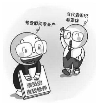
听的是同一套说辞