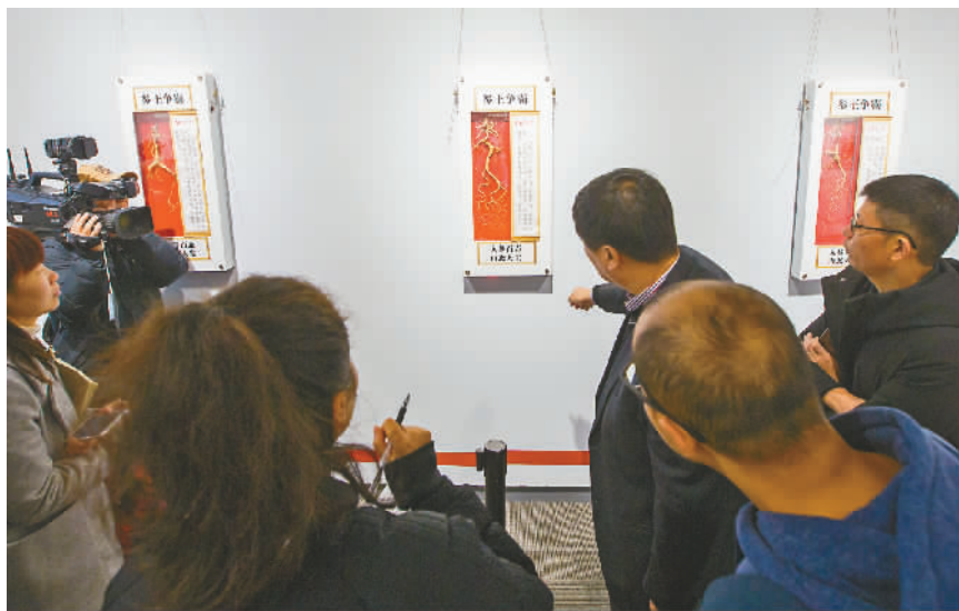
山参科普展吸引了众多市民。

本报联手寿全斋举办的 山参科普展昨开展 40多支珍稀山参亮相 11支百年山参等您命名