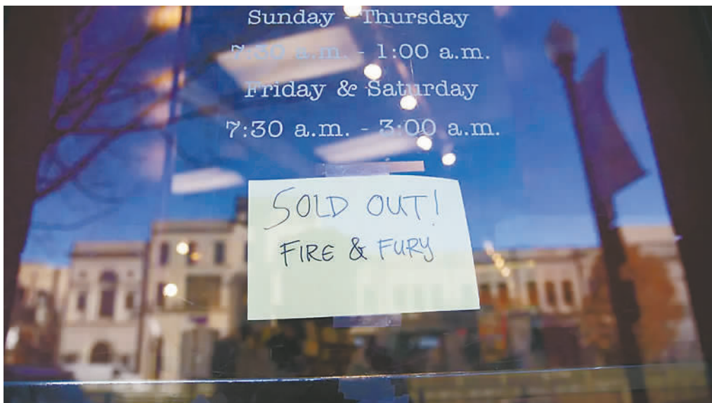
华盛顿一家书店贴出《火与怒》一书售罄告示。

美国有线电视新闻网驻白宫记者斯蒂芬·柯林森认为,这本书对特朗普的形象影响很大,引发的风暴对于白宫来说等同于一场“政治噩梦”。此外,此书相关爆料近日一直盘踞美国各大媒体,本想借年底税改通过的东风在新年再接再厉的特朗普政府被迫笼罩在负面新闻的发酵中。而特朗普和班农公开决裂或影响共和党中期选举的前景,由班农支持的一些反建制派共和党候选人目前面临选边站队的压力。