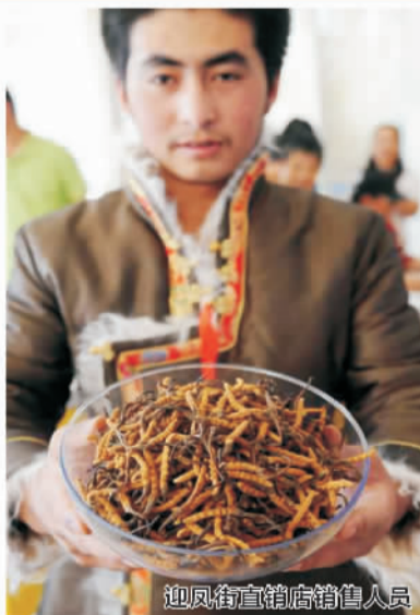
迎凤街直销店销售人员

西藏那曲冬虫夏草：历代医书记载的真正的冬虫夏草均为野生，冬虫夏草生长在海拔3500米至6000米的高山雪线附近的