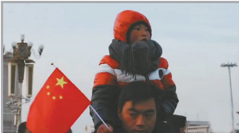
1月20日清晨，“冰花男孩”在天安门广场看升旗仪式。