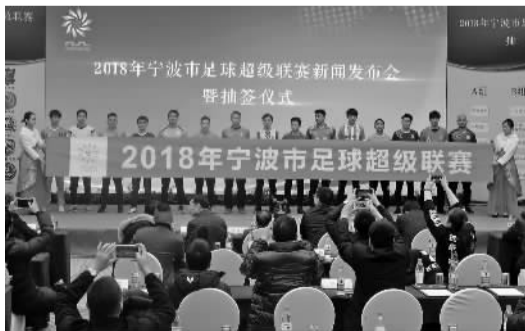
抽签仪式上各球队队服展示。

与上届不同,今年将不单独举办超霸杯赛,而是将超霸杯和甬超联赛合二为一,目的是更高效地“对接”浙江省足球超级联赛。最终的冠军球队成为甬超和超霸杯双料冠军,他们将代表宁波出征2018年浙