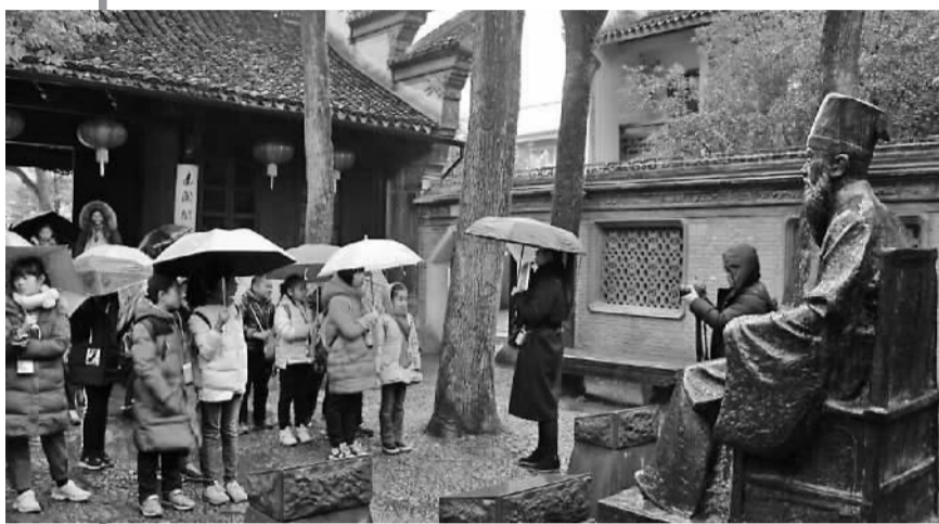
镇海区中心学校的学生在进行宁波藏书文化之旅。

放寒假了,有些家委会正忙着组织学生去“研学”,但有家长说还不如上培训班,还有学校因担心出行安全而顾虑重重。而专家认为:研学旅行,是让学生的身體和心灵一同行走,是知行合一的重要体现。