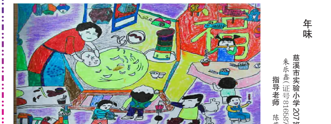
年味 慈溪市实验小学 207班 朱乐鑫(证号816687) 指导老师 陈莹

宁波市广济中心小学世纪苑校区 604班 严若清(证号825221) 今年，我在农村的外婆家过年，发现这里焕然一新。以前的村庄臭气熏天，垃圾随处可见，如今山清水秀，干净整洁。这不由得让我大吃一惊，心中充满了惊喜和疑问。我迫不及待地出门逛村庄，去一探究竟。我发现原来的泥土路变成了水泥路，没有了雨天泥泞的烦恼。当我走到村头的养猪场时，令我惊讶的是这里不但没有了猪粪，而且连养猪场都是静悄悄的。我走近一看，里面居然一头猪都没有！我走到溪边，溪中没有一点垃圾，取而代之的是清幽的溪水，鹅卵石在水底闪闪发光，鱼儿在水中欢畅地游泳，成群的鸭子在小溪中嬉水，一切都是那么美好！ 我带着满腹疑问回到外婆家，发现外婆忙着打扫卫生，清理出许多垃圾。她一看到我，就叫我帮她一起去扔垃圾。我拿起垃圾，习惯性