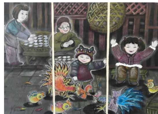
乡下过年 镇海应行久外语实验学校 306班 方哲軒(证号835204)