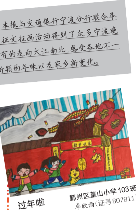
过年啦 鄞州区董山小学 103班 卓欣雨(证号807811)

“砰砰砰！”炮仗也燃放起来了，院子里一片五彩绚丽，春节也在这热闹的气氛中悄悄到来了。 指导老师 陈雅君