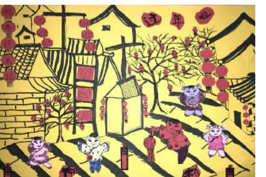
过年啦 鄞州区金家漕小学 203班 沈心羿(证号806564)

转眼，我的记账本上已经写了满满一页，你有什么需要我帮助的吗？赶快告诉我，我也可以帮助你哦！ 指导老师 罗冲