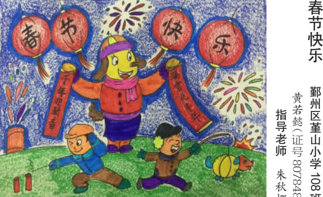
春节快乐 鄞州区董山小学 108班 黄若懿(证号807843) 指导老师 朱秋娜