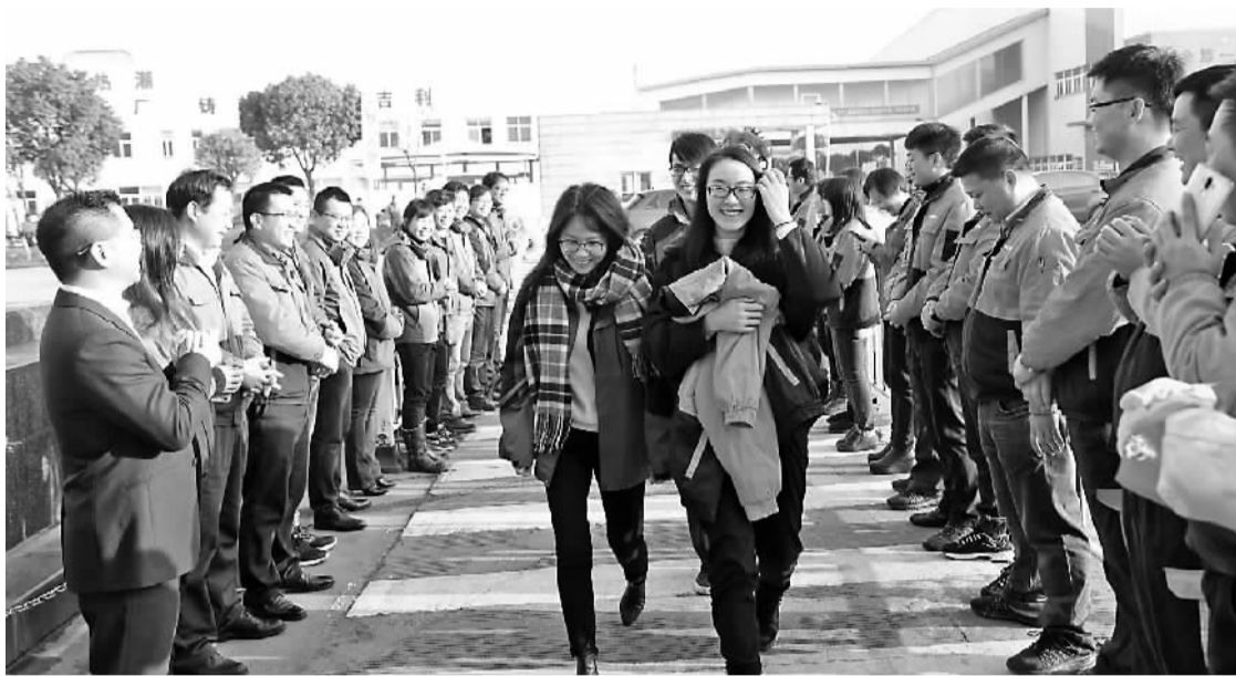
昨天早上,浙江吉利汽车有限公司北仑基地员工高兴地领到红包。

春节长假刚过,宁波的企业陆续迎来复工。昨天是正月初八,万里晴空的好天气也一扫长假里的阴郁感。很多企业选择在这一天开工,为新年博一个好彩头。记者在走访中了解到,不少企业采取了各种方式欢迎员工返岗,激发员工的干劲,增强团队的凝聚力。