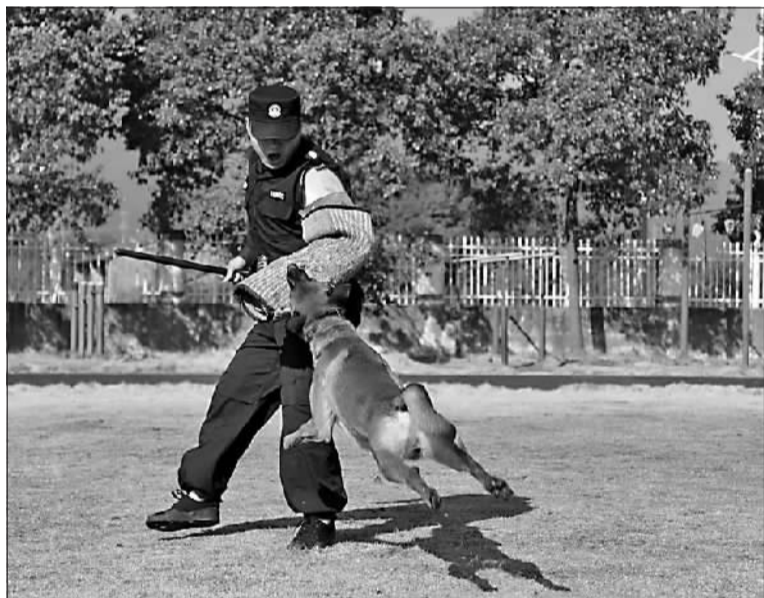
训导员在训练警犬追捕。